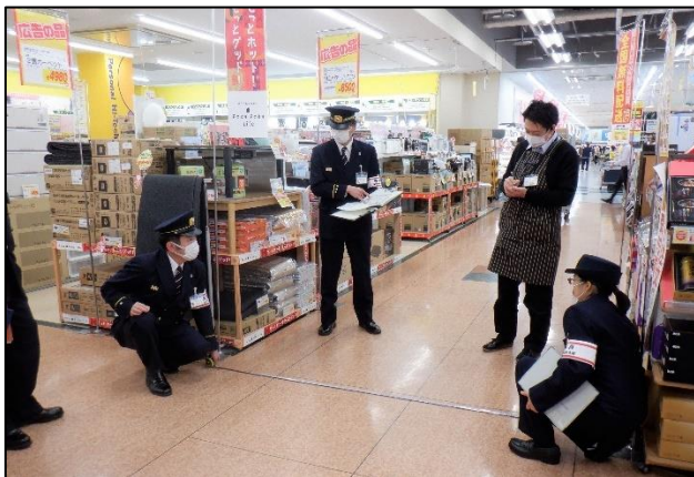
【田方中消防署長 特別査察の様子】