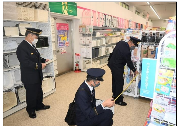
【伊東消防署長 特別査察の様子】