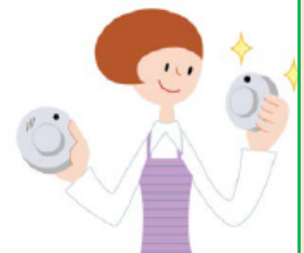
古くなったら交換

※1 警報器の作動確認は、春秋の火災予防運動の時期に行うなど、定期的に実施してください。