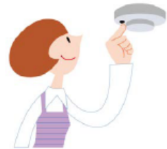
定期的な作動確認

作動確認をしても警報器に反応がなければ、本体の故障か電池切れです。(※2)警報器の本体又は電池を交換しましょう。