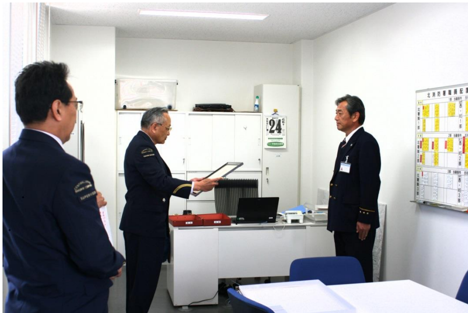
沼津駅駅長(中央)から感謝状を受ける沼津北消防署長(右)

駿東伊豆消防本部は引き続き充実強化を図り、住民の皆様へこれまで以上の安心・安全をお届けできるよう職員一同全力を尽くして参ります。