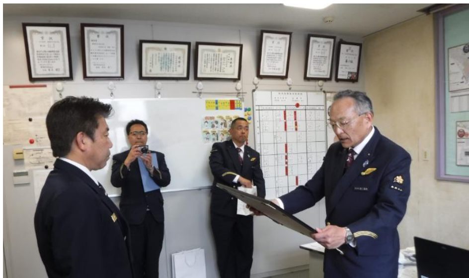
沼津駅駅長(右)から感謝状を受ける沼津南消防署長(左)