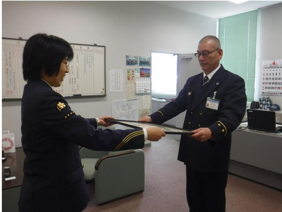
三島駅駅長(左)から感謝状を受ける田方北消防署長(右)